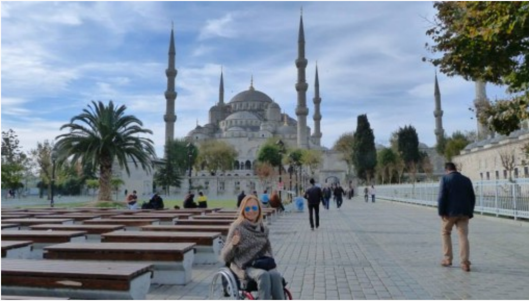
Pamela ad Istanbul capitale della Tuschia